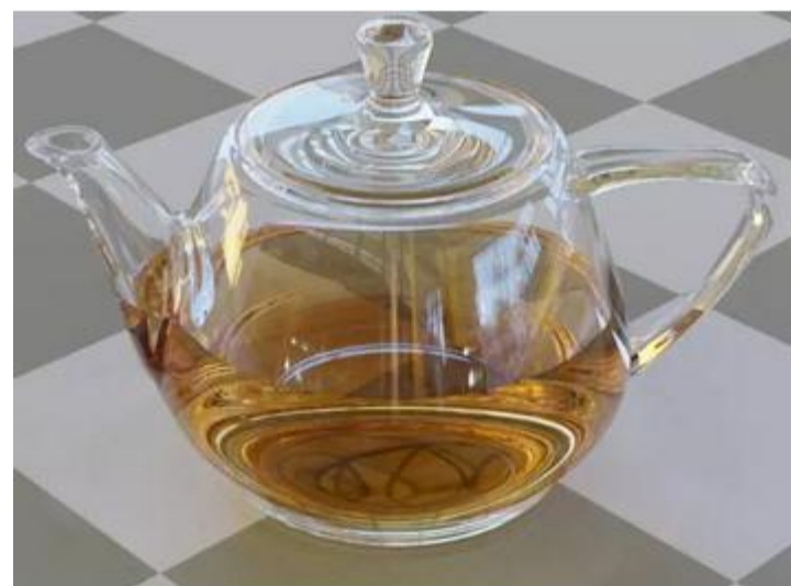
图5. 光线跟踪法渲染的犹他壶。（Ray Tracing Utah Teapot）

这里 (f, g, h) 是分片多项式，如图5所示的犹他壶模型（Utah Teapot）。在光线跟踪法中，每条光线被表示成一条射线 \mathbf{r}(t) = \mathbf{b} + t\mathbf{d}, t \geq 0 ，我们需要计算射线和曲面的交点，这占据了整个计算时间的95%以上。直接用曲面的参数形式计算交点比较困难，我们需要将曲面变换成隐式形式，即为 F(x, y, z) = 0 ，这一过程被称为是参数曲面的隐式化。将射线方程代入隐式曲面，求解关于 t 的一元多项式方程，可以求解交点。参数曲面的隐式化可以直接应用吴方法，消去变元 u, v ，即得隐式曲面。